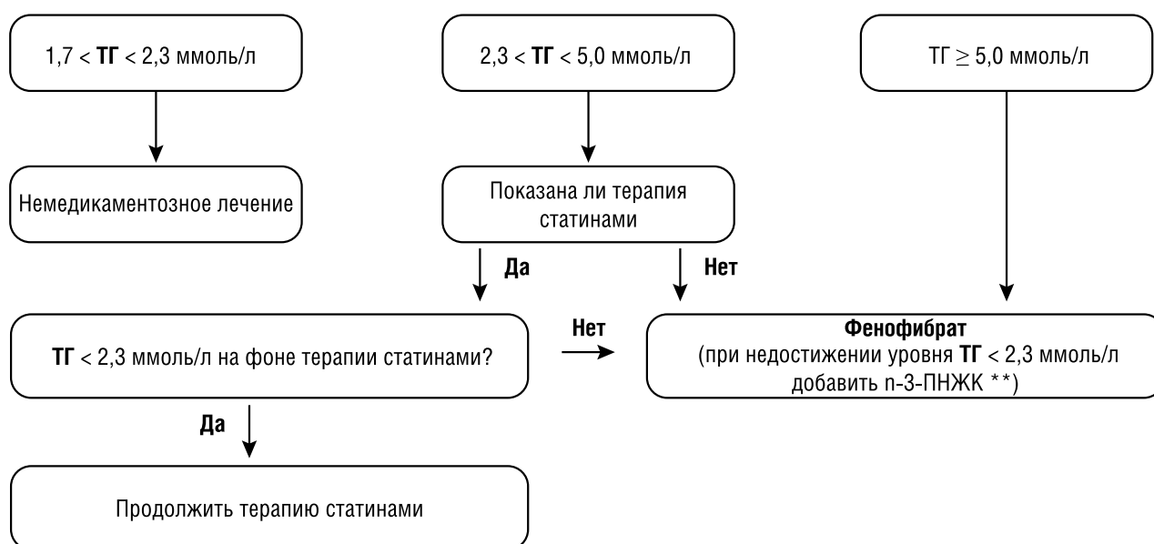
Рис. 2. Алгоритм лечения ГТГ [65, 66]

Примечания: с учетом клинического фенотипа пациента.