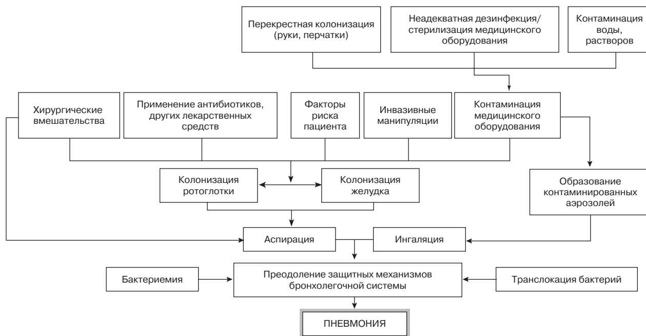
Рис. 1. Схема патогенеза НП [10]

людей. Напротив, колонизация ротоглотки другими грам(–) микроорганизмами и, прежде всего, Pseudomonas aeruginosa и Acinetobacter spp., в норме встречается крайне редко. Однако вероятность орофарингеальной/трахеальной колонизации P. aeruginosa и энтеробактериями возрастает по мере увеличения длительности пребывания в стационаре и (или) увеличения степени тяжести заболевания. При этом вероятность развития НП у пациентов с колонизацией верхних дыхательных путей грам(–) микрофлорой возрастает почти в 10 раз по сравнению с пациентами без грам(–) колонизации.