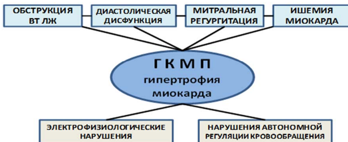
Рисунок 1. Основные патогенетические факторы развития ГКМП

Патофизиология ГКМП определяется сложным комплексом взаимосвязанных звеньев, основными из которых являются: обструкция выносящего тракта левого желудочка (ВТЛЖ), диастолическая дисфункция (ДД), митральная регургитация (МР), ишемия миокарда, электрофизиологические нарушения и аритмии, особенности автономной регуляции кровообращения (рис. 1). Характерно гиперконтрактивное состояние миокарда при нормальной или уменьшенной полости ЛЖ вплоть до ее облитерации в систолу. Расстройства внутрисердечной гемодинамики при ГКМП весьма разнообразны и определяют широкую палитру клинических проявлений: одышка, болевой синдром, аритмии, пре- и синкопальные состояния, высокая вероятность ВСС, снижение толерантности к нагрузкам другие проявления.