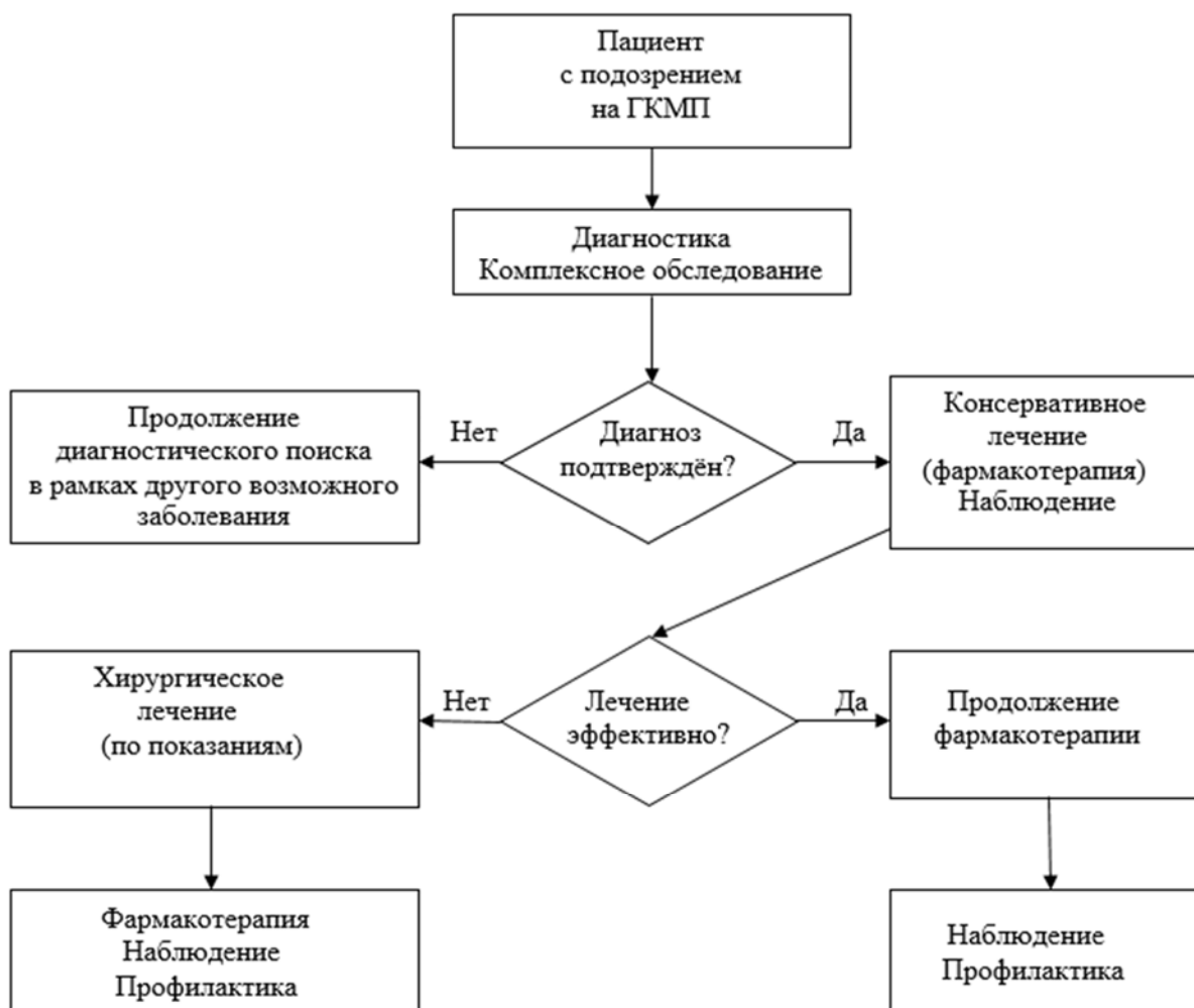
Рисунок 2. Алгоритм диагностики и ведения больных ГКМП